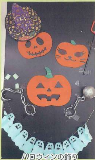
ハロウィンの飾り