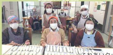
ふれあいクッキングの様子