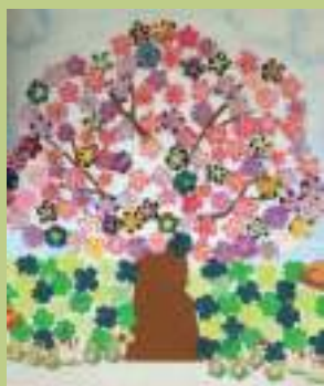
桜木の貼り絵創作