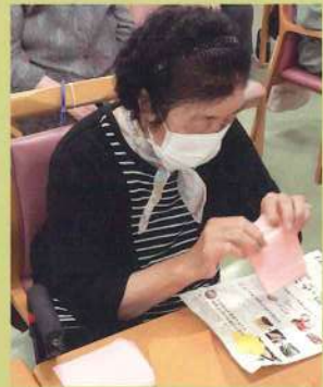
コスモス作成風景