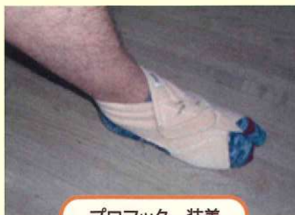
プロフッター装着