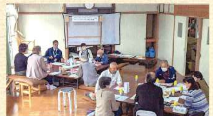
グループに分かれて話し合い

当事業所では、今後も地域の皆様と意見交換をしながら、お互いに支え合う地域づくりのお伝いをしてまいりますので、関心がある方は下記にご連絡を下さい。