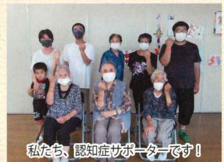
私たち、認知症サポーターです！

受講した方から「認知症の方や家族が身近にいたらサポートしたい」「認知症の方にきちんと接しようと思えた」などの感想を頂き、今後もこの講座を行い、認知症の人や家族を支援する取り組みを継続していく必要性を改めて感じました。講座は随時行っておりますので、関心がある方はお近くの在宅介護支援センターにお問合せください。