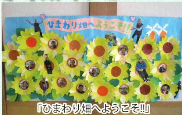
「ひまわり畑へようこそ!!」

利用者様と職員の共同作品。みなさまの笑顔でひまわりを一段と華やかにさせてくれています。