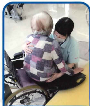
ボードを使用した移乗

みのり苑では、5月よりノーリフティングケアに取り組んでいます。職員と利用者様双方が日常生活を健康的に楽しく過ごして頂けるよう、取り組んでまいりますので、これからもよろしくお願ひします。