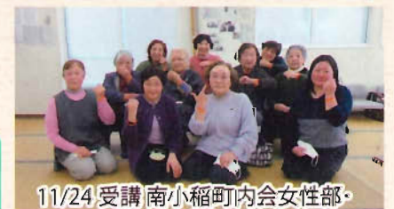
11/24 受講 南小稲町内会女性部・南小稲寿会の皆さん