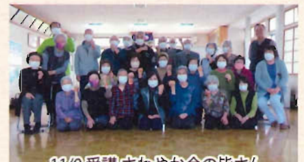
11/9 受講 さわやか会の皆さん