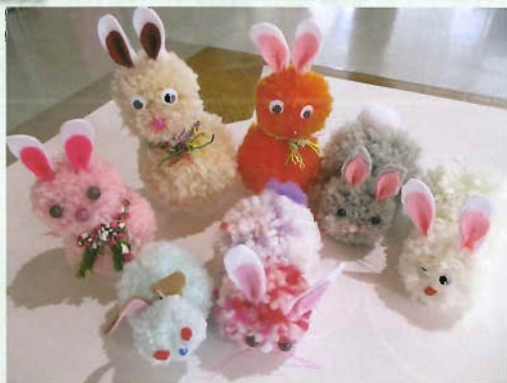
「ウサギのマスコット」