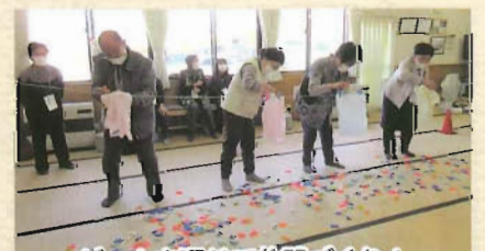
ゲームを通じて仲間づくり！