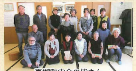
吾郷町内会の皆さん

十和田在宅介護支援センターは『地域の身近な相談窓口』ですので、お気軽にご相談下さい。