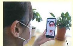
・オンライン面会

施設にお越しただけであれば専用の携帯端末を使用したオンライン面会を行うことができます。（事前予約が必要となります）