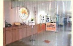
・入所エリア入口

施設内感染拡大防止の為、ホールや食堂等の共用スペースと居室エリアを区切るビニールカーテンを設置しています。