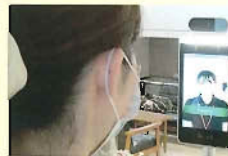
・非接触型体温計（サーマルカメラ）

各施設の玄関に非接触型の体温計（サーマルカメラ）と手指消毒用のアルコール消毒液を設置しています。来苑される方は体温測定と手指消毒をお願いします。