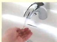
・非接触式手洗い場

接触感染防止のため、蛇口付近に手をかざすだけで水が出る非接触式の手洗い場を完備しています。