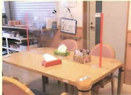
・デイサービスホール