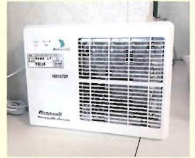
・低濃度オゾン発生器

※光触媒除菌脱臭機： 光が当たると化学反応によってウイルス・細菌を分解（殺菌）する能力を持った素材を、フィルターに使用しています。