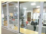
・窓口透明カーテン