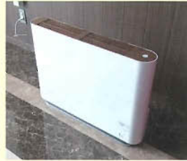
・光触媒除菌脱臭機

各施設の食堂・リビング等の共用スペースに、新たに光触媒除菌脱臭機と低濃度オゾン発生器を設置し空間除菌能力を高め、利用者様に安心して施設を利用していただけよう努めています。