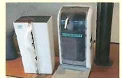
・アルコール消毒液