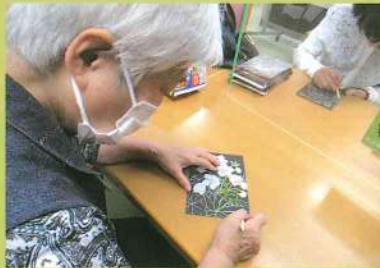
スクラッチアート