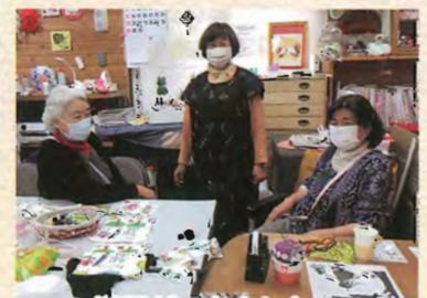
洋服ができました！

十和田在宅介護支援センターは『地域の身近な相談窓口』ですので、お気軽にご相談下さい。