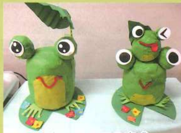
かわいいカエル完成