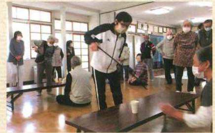
紙コップをつかめるかな？

十和田在宅介護支援センターは『地域の身近な相談窓口』ですので、お気軽にご相談下さい。