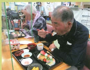
寿司の日美味しかったです！