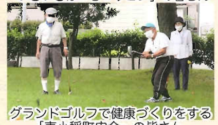
グラウンドゴルフで健康づくりをする 「東小稲町内会」の皆さん