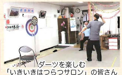
ダーツを楽しむ 「いきいきはつらつサロン」の皆さん

十和田在宅介護支援センターは『地域の身近な相談窓口』ですので、お気軽にご相談下さい。 ●お問合せ先 電話 (0176) 22-6666 [担当/石橋]