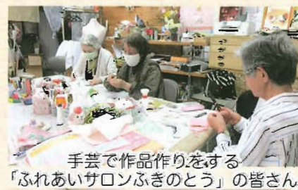
手芸で作品作りをする「ふれあいサロンふきのとう」の皆さん

十和田在宅介護支援センターは『地域の身近な相談窓口』ですので、お気軽にご相談下さい。 ●お問合せ先 電話 (0176) 22-6666 [担当/石橋]