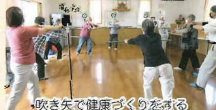
吹き矢で健康づくりをする「西小稲心交会」の皆さん