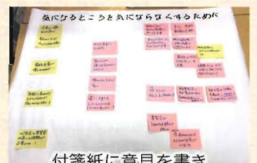
付箋紙に意見を書き「見える化」しました

十和田在宅介護支援センターは『地域の身近な相談窓口』ですので、お気軽にご相談下さい。