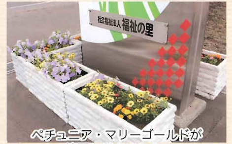
ペチュニア・マリーゴールドが綺麗に咲きました。

7月7日は七夕の日！「いくつになっても季節の行事は楽しみね～」と話しながら七夕飾りを作りました。この日は「手作りおやつの日」で、「五平餅」を頂いたあと、短冊に願い事を書きました。飾りつけをするのが今からとても楽しみです。