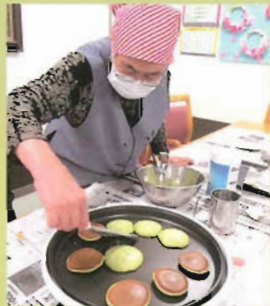
抹茶どら焼き作ってます