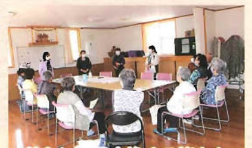
熱心に意見交換する皆さん

昨年度に引き続き、西小稲町内会楽笑会の皆さんと座談会を行いました。今回は、現在楽笑会が行っている活動の良いところ、気になるところを挙げ、『気になるところを気にならなくするためには、どうすれば良いか』について話し合いました。参加者の皆さんからは「活動が続けるためには、まずは自分たちが元気でいましょう。」「会で行っていることを具体的に紹介して、周りの人を誘ってみましょう。」など、前向きな意見が交わされました。十和田在宅介護支援センターでは、今後も地域の皆様と話し合う場を持ちながら地域づくりのお手伝いをしてまいりますので、どうぞよろしくお願いいたします。