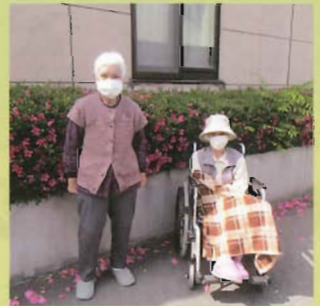
綺麗に咲きました!