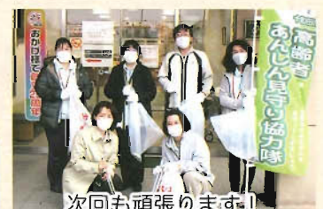
次回も頑張ります！

十和田在宅介護支援センターは『地域の身近な相談窓口』ですので、お気軽にご相談下さい。