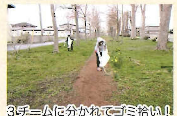
3チームに分かれてゴミ拾い！

これからも地域の皆様が、気持ち良く過ごせるように少なからず貢献していきたいと思っております。