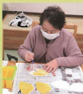
コーヒーフィルターで作品作り