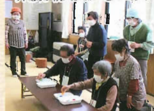
レクリエーション大会の様子