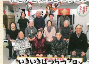
いきいきはつらつサロン 結成10周年を迎えました