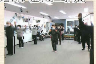
介護予防体操の様子