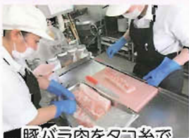
豚バラ肉をタコ糸で丁寧に巻きます