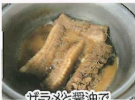
ザラメと醤油で甘辛く煮ます