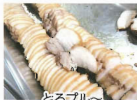
とろブル〜柔らかく煮えました!!